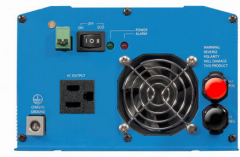
Phoenix Inverter 12/800 with Nema 5-15R socket