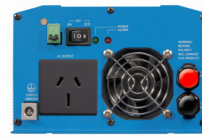
Phoenix Inverter 12/800 with AN/NZS 3112 socket