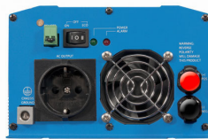
Phoenix Inverter 12/800 with Schuko socket