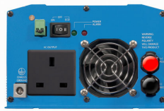
Phoenix Inverter 12/800 with BS 1363 socket