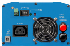
Phoenix Inverter 12/800 with IEC-320 socket