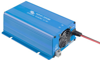
Phoenix Inverter 12/180