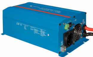
Phoenix Inverter 12/800 with Schuko socket

Veuillez consulter les photos ci-dessous.