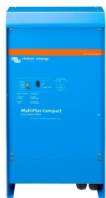
MultiPlus Compact 12/2000/80

Si des systèmes disposant d'un tableau de commande Color Control sont connectés par Ethernet, il est possible d'y accéder et de modifier leur configuration.