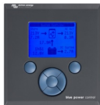
Tableau de commande Blue Power

Une solution pratique et bon marché pour une surveillance à distance, avec un bouton rotatif pour configurer les niveaux de Power Control et Power Assist.