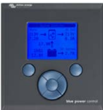
Tableau de commande Blue Power Se connecte à un Multi ou un Quattro, ou à tous les appareils VE.Net, en particulier le Contrôleur de batterie VE.Net. Affichage graphique des courants et des tensions.